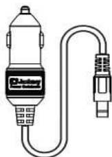
車載用 充電シガーソケット